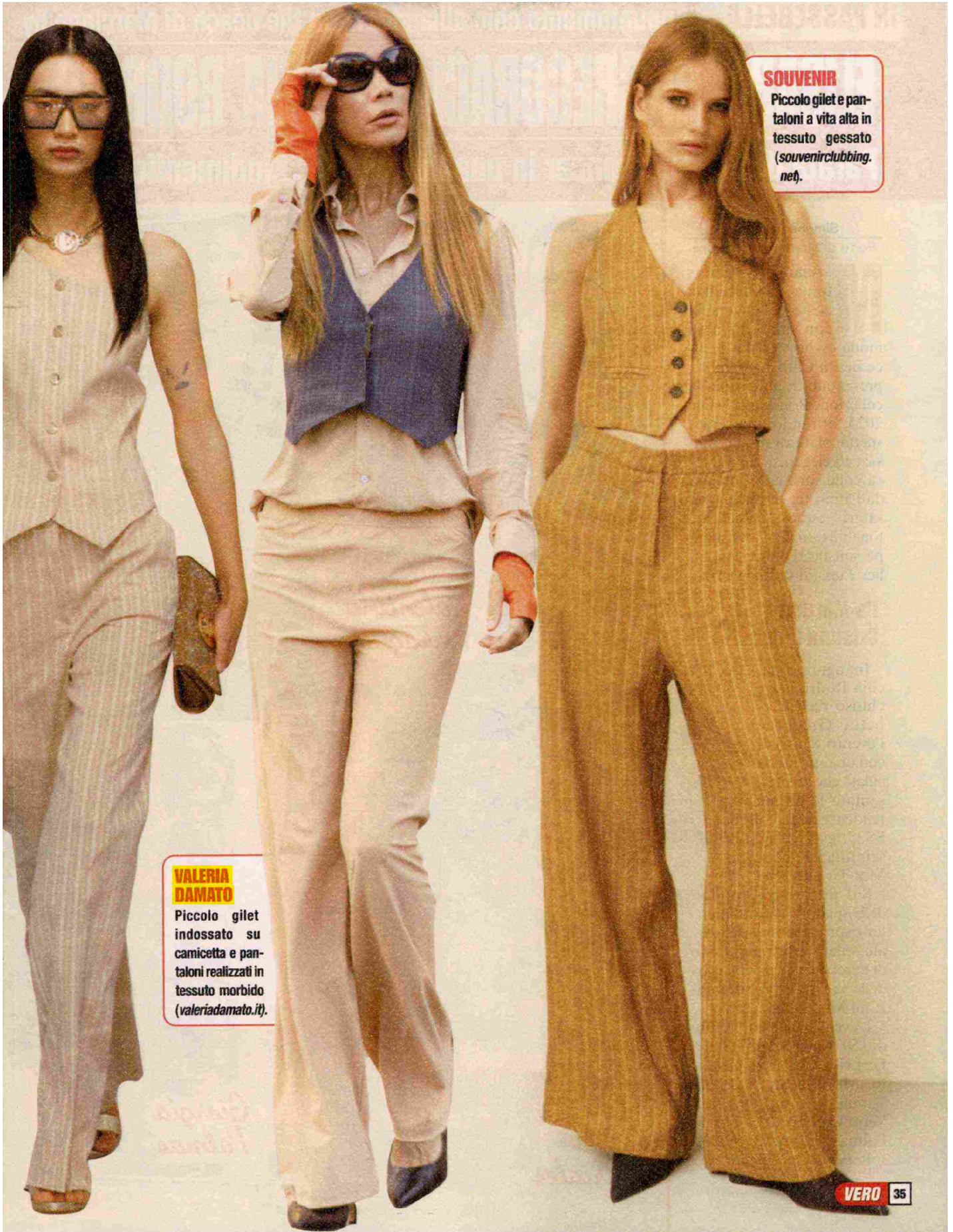
SOUVENIR Piccolo gilet e pantaloni a vita alta in tessuto gessato (souvenirclubbing.net).