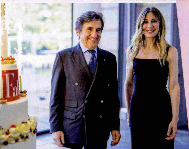
In alto, una veduta dei Dazi Milano, in piazza Sempione, la location scelta per il nostro party. Qui sopra, Urbano Cairo, presidente del gruppo Cairo Communication, Rcs MediaGroup, Torino Fc e La7, con Francesca Fagnani, giornalista e scrittrice, protagonista della cover e del numero speciale di F. A destra, Luca Dini, direttore di F e Natural Style, con Francesca Fagnani.