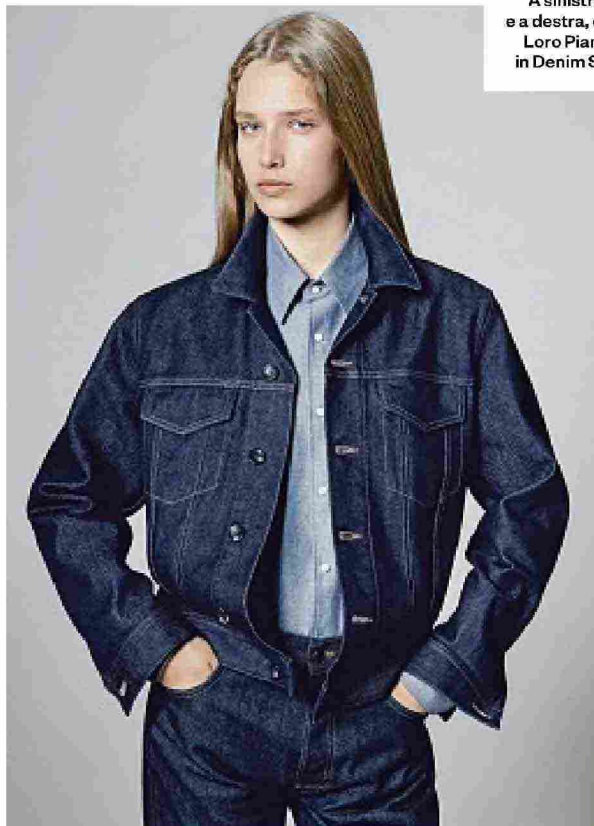
A sinistra e a destra, capi Loro Piana in Denim Silk.