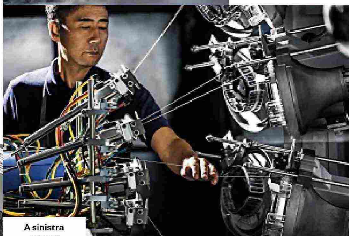
A sinistra e sopra, momenti di lavorazione.